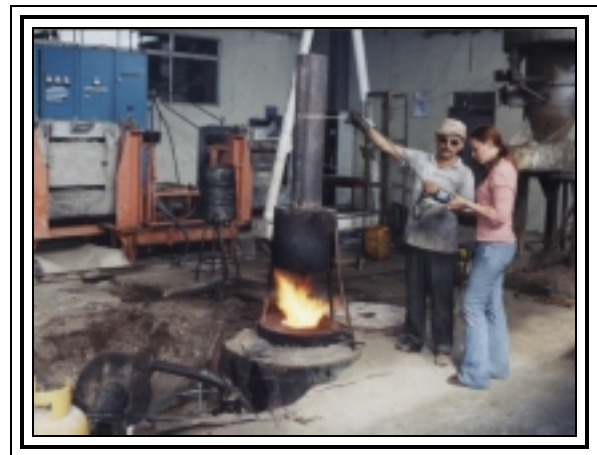
Figura 2. Momento en que se realiza un ensayo de medición de gases, en los puertos de toma de muestra