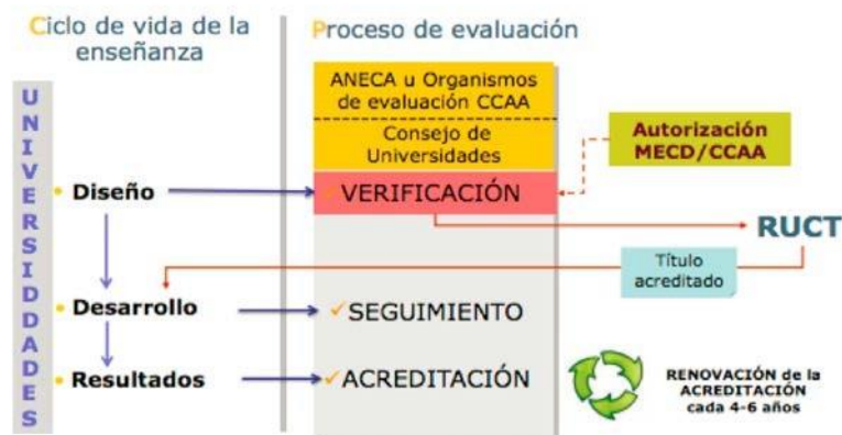
Fig. 3. Ciclo de vida de las enseñanzas universitarias y procesos de evaluación.

En la fase primera (ex ante) se produjo la verificación del título (Programa VERIFICA) tras la comprobación del cumplimiento de los criterios y estándares de calidad establecidos por el EEES en el diseño del plan de estudios. Durante su desarrollo y de forma periódica, el grado ha sido sometido a procesos de monitorización externas con la finalidad de establecer planes de mejora de las enseñanzas ofrecida al alumnado (Programa MONITOR).